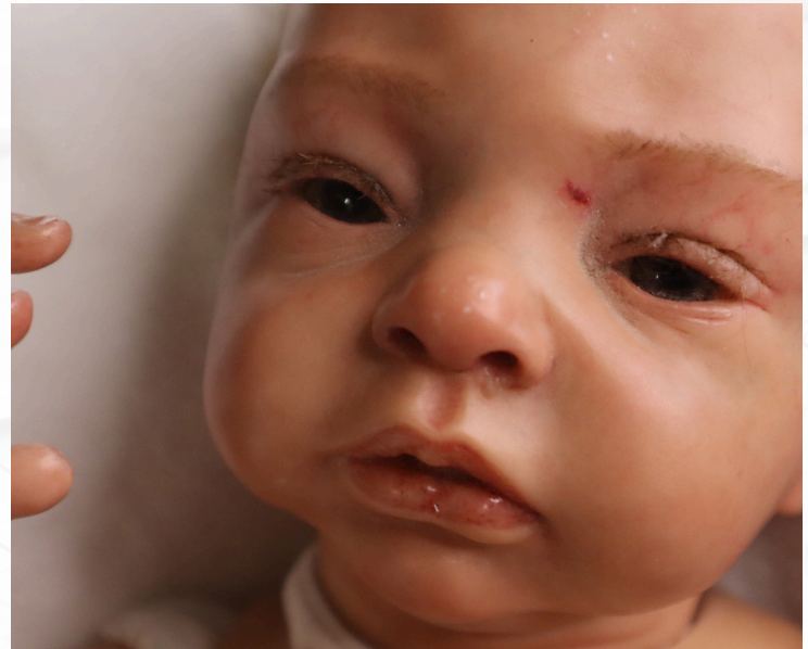
BÉBÉ REBORN MATTHÉO - 2024