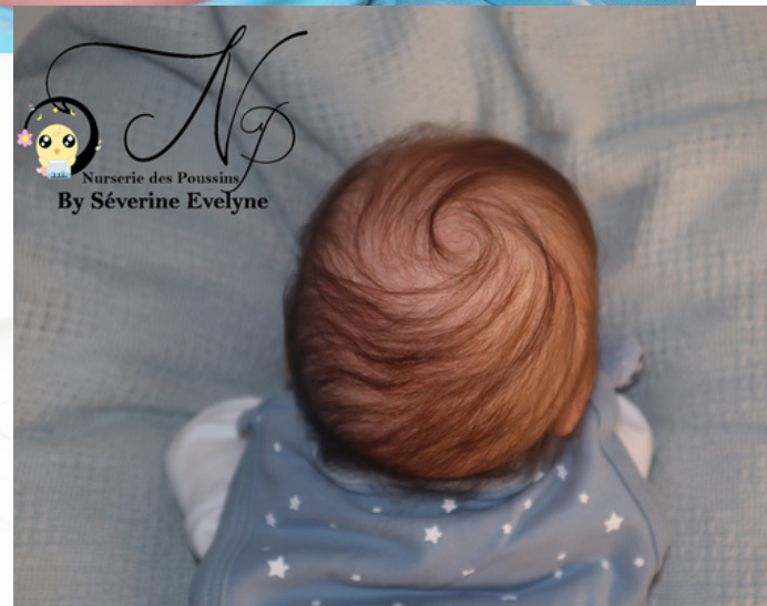
BÉBÉ REBORN MATTHÉO - 2024