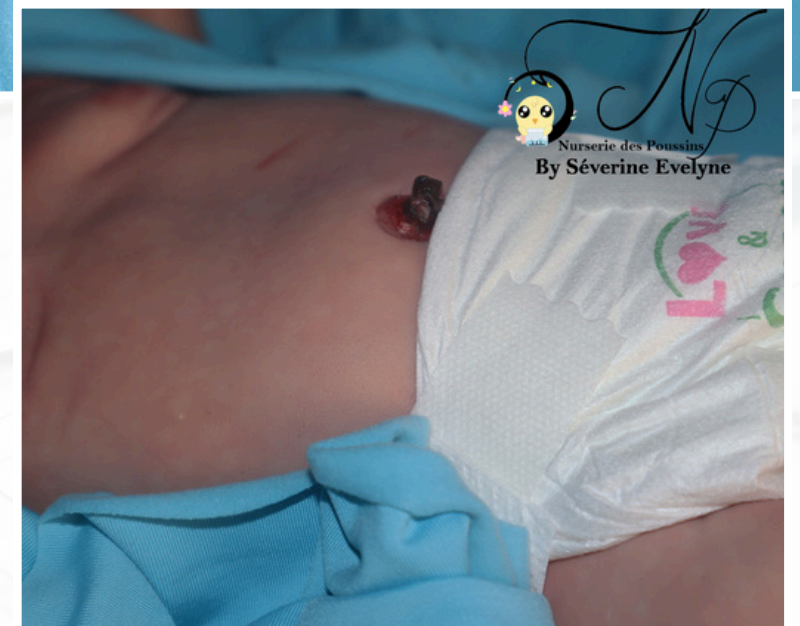
BÉBÉ REBORN MATTHÉO - 2024