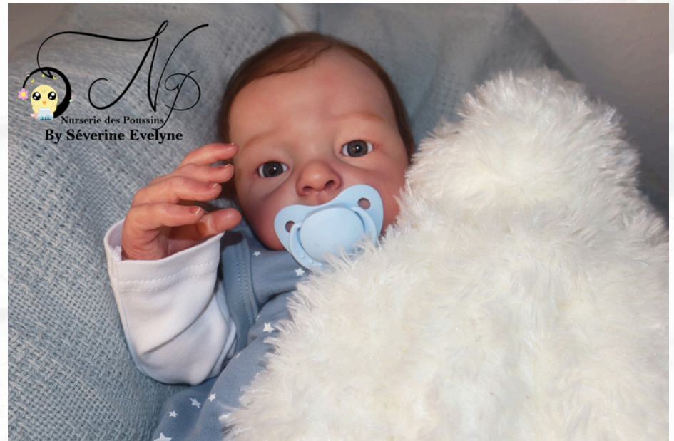
BÉBÉ REBORN MATTHÉO - 2024