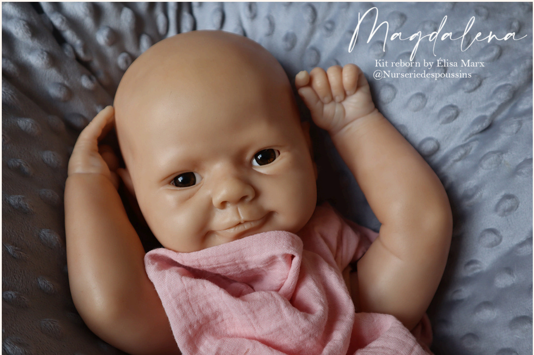
Kit en cours de création “Métisser”