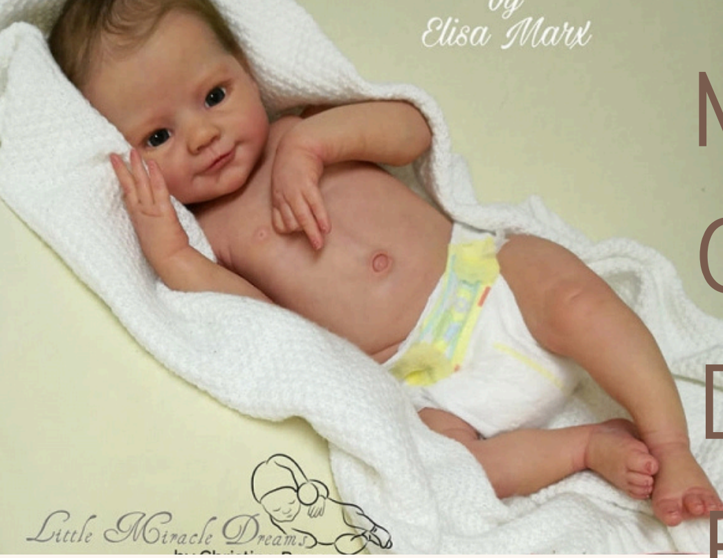
by Elisa Marx