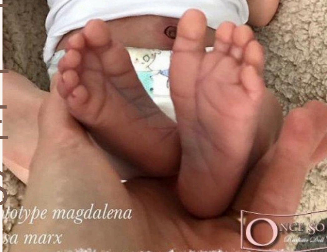
prototype magdalena sa marx